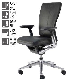
(可動肘付4Dアームタイプ)

外寸法 / W737×D737×H1200～1350 座寸法 / SW510×SD445～510×SH406～533 背面・座面:本革張り 肘:4Dアーム 脚部:アルミダイカスト磨き仕上げ ナイロン双輪キャスター付