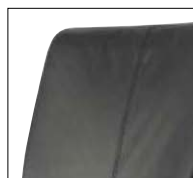
●本革張り背もたれ (SZT-11-724MA1)

上下に60mmの範囲で調整可能です。首から頭部を支え、後傾姿勢をサポートします。