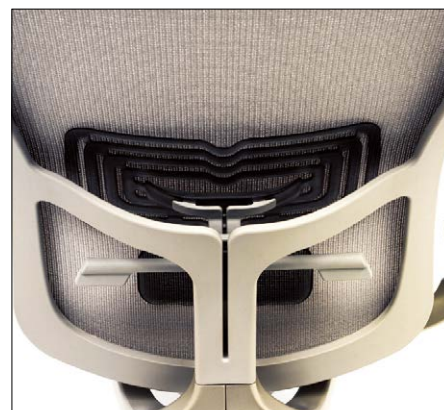
●ランバーサポート (SZE-11-724MA1・SZT-11-724MA1・SZT-20-724MA1・SZT-20-412MA1)

ランバーサポートは腰(腰椎)をサポートし、体に合った位置に調節することで腰への負担を軽減します。ランバーサポートのバーの両側を両手でつかみ、上下させることで、体に合った高さに調節します。両端のつまみを回転させることで、左右非対称の腰にサポート力を調節出来ます。