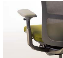
●4Dアーム機能 (SZE-11-724MA1) (SZT-11-724MA1) (SZT-20-724MA1)

アームキャップは、前後、上下、左右に動き、また左右20°に回転しますので、状況に応じてお好みの位置でご使用ください。