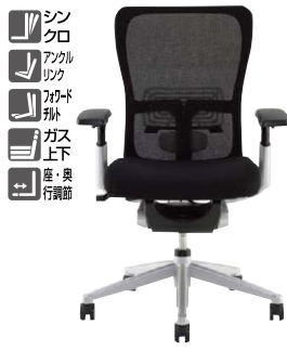
(可動肘付4Dアームタイプ)

外寸法 / W737×D737×H965～1092 座寸法 / SW510×SD445～510×SH406～533 背面・座面:本革張り 肘:4Dアーム 脚部:アルミダイカスト磨き仕上げ ナイロン双輪キャスター付