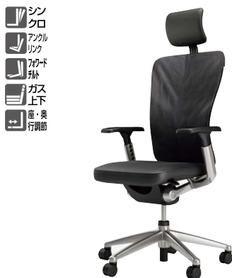
(可動肘付4Dアームタイプ・ヘッドレスト付)