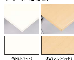
-WH(ホワイト) -SW(シルクウッド)