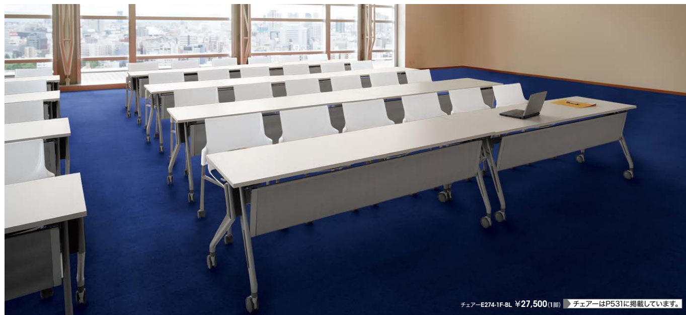
チェア-E274-1F-BL ¥27,500(1脚) チェアはP531に掲載しています。