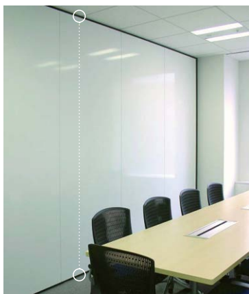
シンクロンは、天井部と床部を専用部品でつなぐ