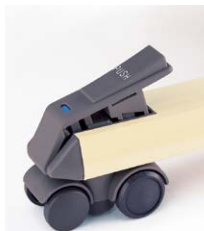
プッシュ式ストッパー

中央のステップを踏むことにより天板の高さを (H680～H870 までの間) 調節することができます。