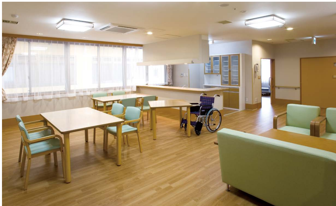
特別養護老人ホーム 食堂・居間

ナイキでは心の通ったモノづくりを基本としたクオリティの高い商品群と、長年にわたって快適環境を創造してきたノウハウを活かして、すこやかに過ごせる高齢者福祉施設をご提案。利用者とスタッフの方々のニーズにお応えする空間をプランニングいたします。