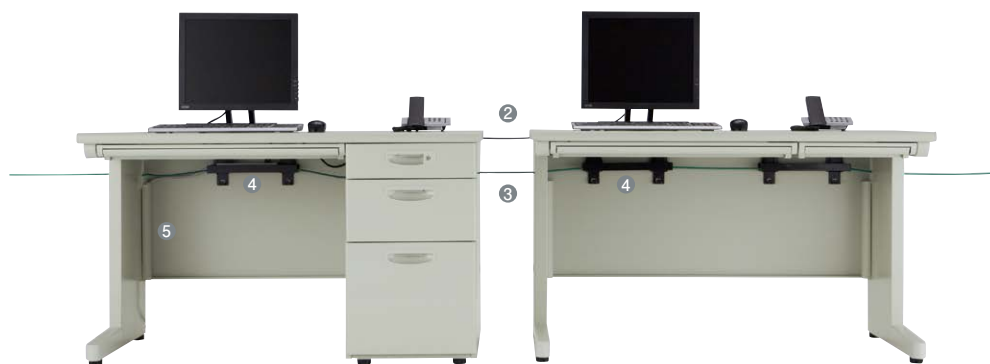
開閉式配線カバー