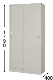
■引違い書庫(スチール戸) HS36J-AW ¥73,000○ 外寸法／W880×D400×H1790 棚寸法／W860×D310 内寸法／W820×D340×H1655 付属品：棚板4枚 質量：51kg