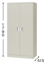
■奥深両開き書庫 K367N-AW ¥83,700○ 外寸法／W880×D515×H1790 棚寸法／W858×D435 内寸法／W810×D483×H1628 付属品：棚板4枚 質量：55kg