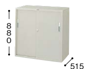
HS337-AW ¥49,300○ 外寸法／W880×D515×H880 棚寸法／W858×D435 内寸法／W820×D455×H810 付属品：棚板1枚・ブックサポーター2本 質量：31kg