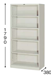
■オープン書庫 KT366-AW ¥47,200○ 外寸法／W880×D380×H1790 棚寸法／W860×D310 内寸法／W830×D378×H1665 付属品：棚板4枚 質量：32kg