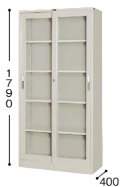
■引違い書庫(ガラス戸) HG36J-AW ¥89,900○ 外寸法／W880×D400×H1790 棚寸法／W860×D310 内寸法／W820×D340×H1655 付属品：棚板4枚 質量：55kg