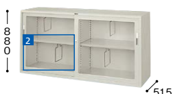
HG637-AW ¥93,400○ 外寸法／W1760×D515×H880 棚寸法／W858×D435 内寸法／左W843・右W832×D455×H810 付属品：棚板2枚・ブックサポーター4本 質量：58.5kg