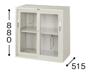
HG337-AW ¥55,200○ 外寸法／W880×D515×H880 棚寸法／W858×D435 内寸法／W820×D455×H810 付属品：棚板1枚・ブックサポーター2本 質量：33kg