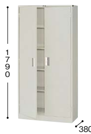
■両開き書庫 K366J-AW ¥56,600○ 外寸法／W880×D380×H1790 棚寸法／W860×D310 内寸法／W810×D348×H1628 付属品：棚板4枚 質量：45.6kg