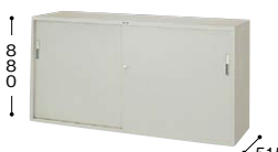
HS637-AW ¥83,700○ 外寸法／W1760×D515×H880 棚寸法／W858×D435 内寸法／左W843・右W832×D455×H810 付属品：棚板2枚・ブックサポーター4本 質量：56.5kg