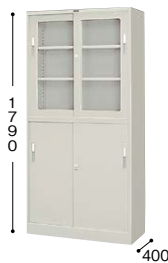
■引違い書庫(ガラス・スチール戸) HGS36-AW ¥94,700○ 外寸法／W880×D400×H1790 棚寸法／W860×D310 内寸法／W820×D340×H1620 付属品：棚板4枚 質量：60.5kg