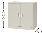
■奥深両開き書庫 K337N-AW ¥49,900○ 外寸法／W880×D515×H880 棚寸法／W858×D435 内寸法／W810×D483×H733 付属品：棚板1枚 質量：33kg