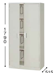
■奥深両開き書庫 K367-AW ¥80,400○ 外寸法／W880×D515×H1790 棚寸法／W858×D435 内寸法／W810×D484×H1628 付属品：棚板3枚・ブックサポーター4本 質量：53kg