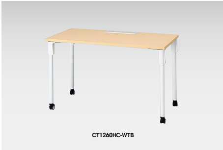
リフトアップキャスター