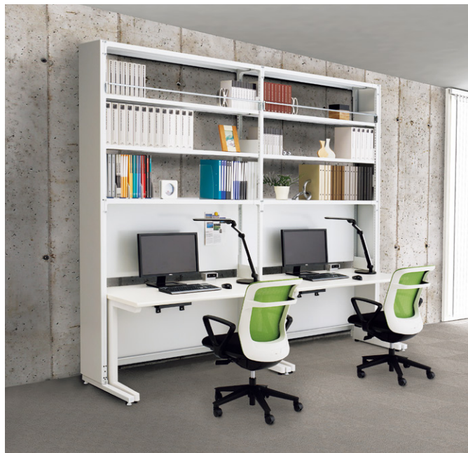
※転倒防止の為、壁固定金具・床固定金具・天ツナギのいずれかを施してください。(別注)