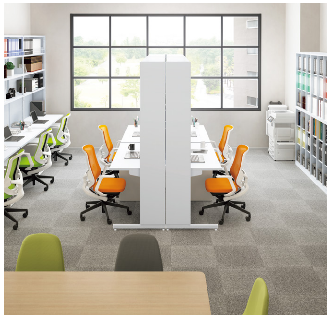
※対向レイアウト(中置)でご使用の場合は、必ず天ツナギ又は安定脚を取付けてください。