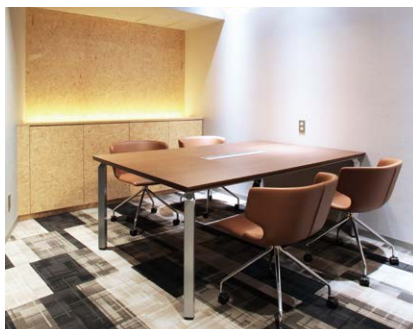
リビングスペースのような雰囲気での商談や相談を。