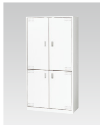
オフィスキッチン