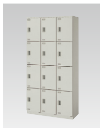
スクールロッカー