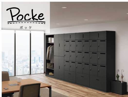
パーソナルロッカー(PK型)