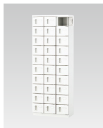
小物入れロッカー