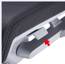
座面奥行調節レバー