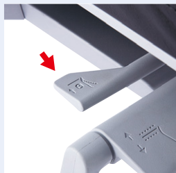
初期位置固定レバー