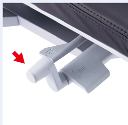
ロッキング強弱ハンドル