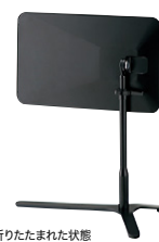
折りたたまれた状態