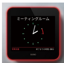
使用中画面イメージ