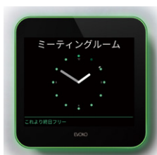
空き室画面イメージ