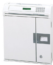
Ⓒ 21本タイプ(プリンタ付き) 外寸法 / W352×D135×H410 質量: 約8.2kg