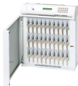
Ⓑ 30本タイプ 外寸法 / W352×D135×H410 質量: 約7.4kg