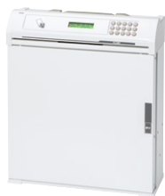
Ⓐ 20本タイプ 外寸法 / W352×D135×H410 質量: 約7.1kg