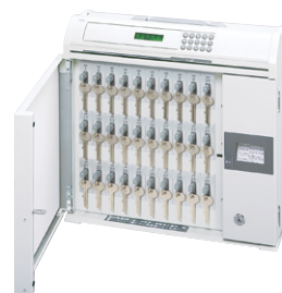
Ⓓ 30本タイプ(プリンタ付き) 外寸法 / W436×D135×H410 質量: 約9.7kg