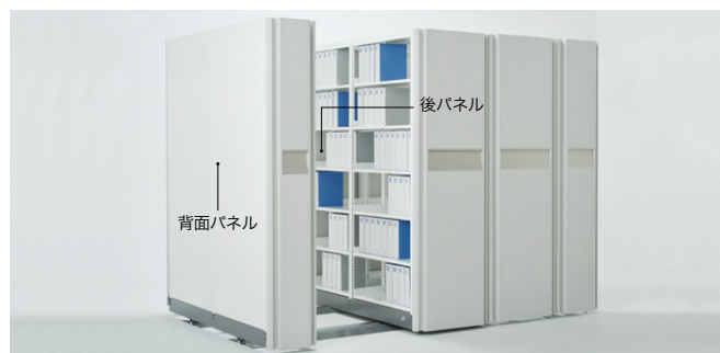
※背面パネルと後パネルはオプションです。

よく触れるからこそ細菌の増殖を抑えるクリーンな抗ウイルス・抗菌樹脂ハンドルを採用! 搭載されている書架も抗ウイルス・抗菌粉体塗装が施された安全・安心・清潔な移動ラックです。 ※書架は抗ウイルス粉体塗装を承ります。詳しくは担当者にお問い合わせください。