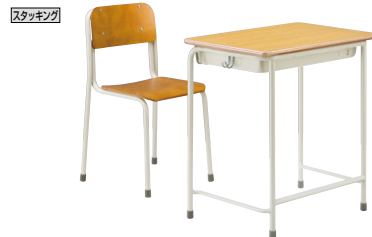
■学校用デスク(JIS適合タイプ)