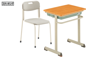
■学校用デスク(JIS適合タイプ)