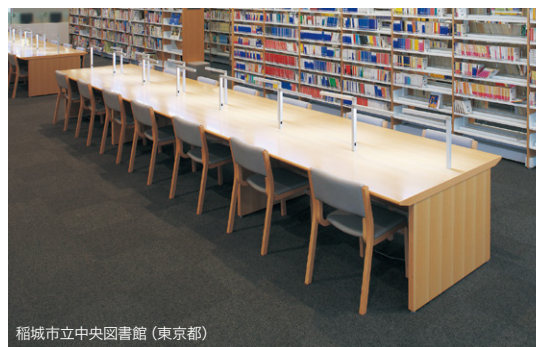
稲城市立中央図書館 (東京都)