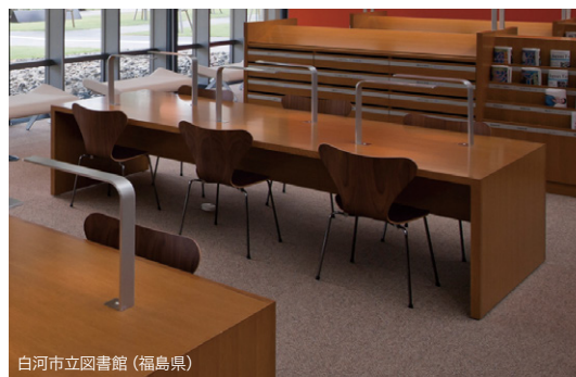
白河市立図書館 (福島県)