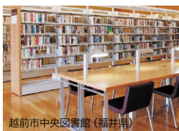
越前市中央図書館 (福井県)