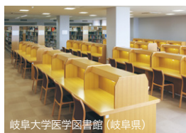
岐阜大学医学図書館 (岐阜県)