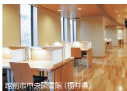
越前市中央図書館 (福井県)