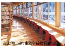
富士河口湖町生涯学習館 (山梨県)