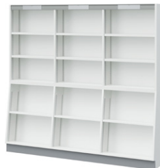
■傾斜付5段書架 NBP-250A-751 ¥327,000 Ⓜ 外寸法 / W1800×D330(240)×H1700 樹脂コート化粧パーティクルボード 質量:95kg