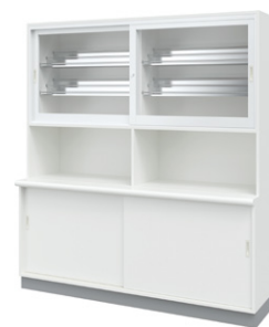
■薬品戸棚 NMB-5A ¥615,000 Ⓜ 外寸法 / W1800×D600(450)×H2000 樹脂コート化粧パーティクルボード 扉:スリムアルミ枠・透明強化ガラス 質量:205kg