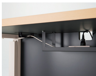
配線受けと横渡し配線フックは標準装備で配線をスッキリ行えます。