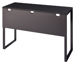
幕板には配線とオプション取付のための切欠きがついています。