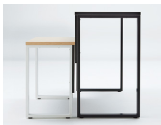
H720とH1000タイプをご用意。